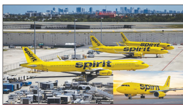
17 हजार नौकरियों पर संकट

नई दिल्ली। पश्चिम एशिया में जारी संकट और तेल की बढ़ती कीमतों के बीच अत्यंत कम लागत वाली अमेरिकी एयरलाइंस कंपनी स्प्रिट एयरलाइन ने 34 साल बाद अपने परिचालन को तुरंत प्रभाव से बंद करने का ऐलान किया है। कंपनी ने अपनी सभी उड़ानें रद्द कर दी हैं और ग्राहक सेवा को बंद कर दिया गया है।