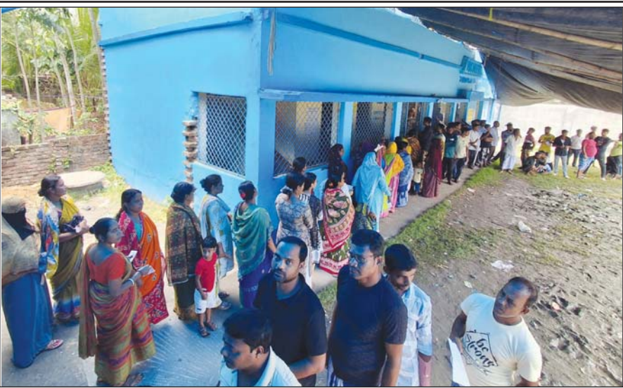
दक्षिण 24 परगना के उस्ती थाना अंतर्गत मगराहाट पश्चिम में बहिरपुया कुरकुरिया प्राइमर स्कूल में पुनर्मतदान।

इसके अलावा, देर रात स्ट्रॉन्गरूम के आसपास अज्ञात लोगों की गतिविधियां और असाामान्य आवाजों को लेकर भी सवाल उठ रहे हैं। हालांकि चुनाव आयोग ने सुरक्षा और पारदर्शिता बनाए रखने का भरोसा दिया है, लेकिन लगातार उठ रहे सवालों से प्रशासन की भूमिका पर संदेह गहराता जा रहा है।